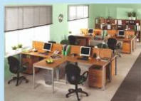
Стол на P-образных опорах

Основные достоинства металлокаркаса с опорами P-образной формы — высокая жесткость и универсальность конструкции. На сегодняшний день они являются самыми прочными и надежными!